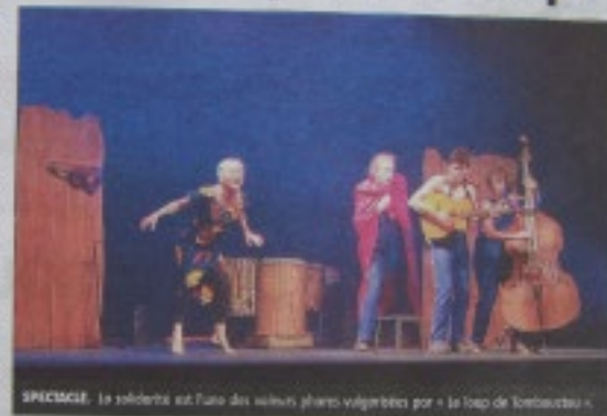
SPECTACLE. La solidarité est l'une des valeurs phares véhiculées par « Le loup de Tombouctou ».

Des références aux contes connus de tous, punctuant la représentation. Le