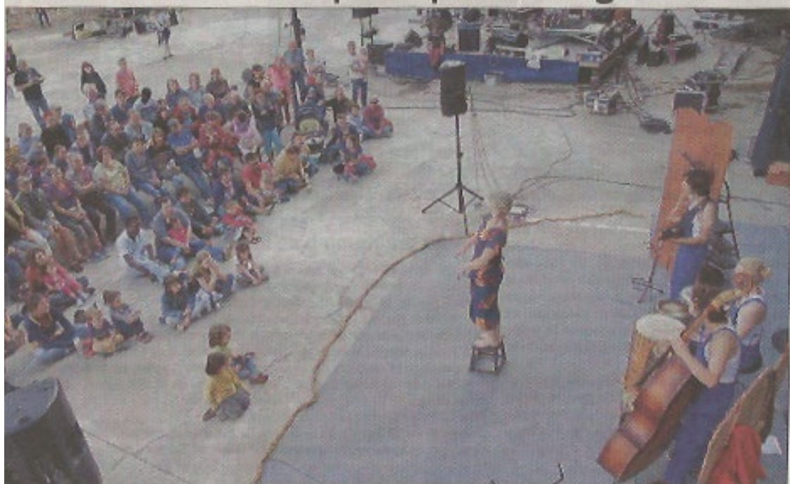
SPECTACLE. La compagnie uzerhoise avait déplacé la foule lors de sa prestation dans la Perle du Limousin.

Depuis le début de l'année 2014 ont entend parler du fameux Loup de Tombouctou. Un conte musical né de l'association P'tits Bouts & Cie, domiciliée dans la Perle du Limousin.