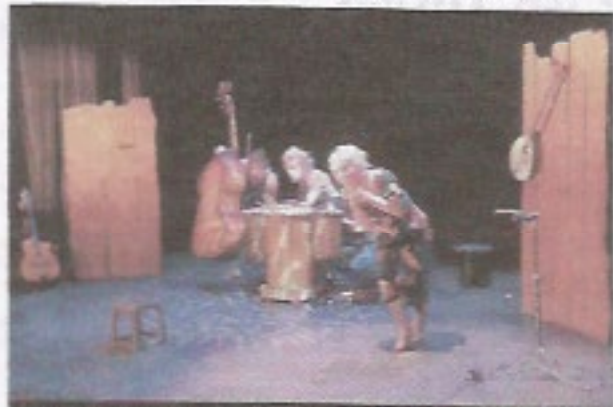
DÎNER SPECTACLE. Une partie de la troupe " P'tits bouts et cie " sur scène.